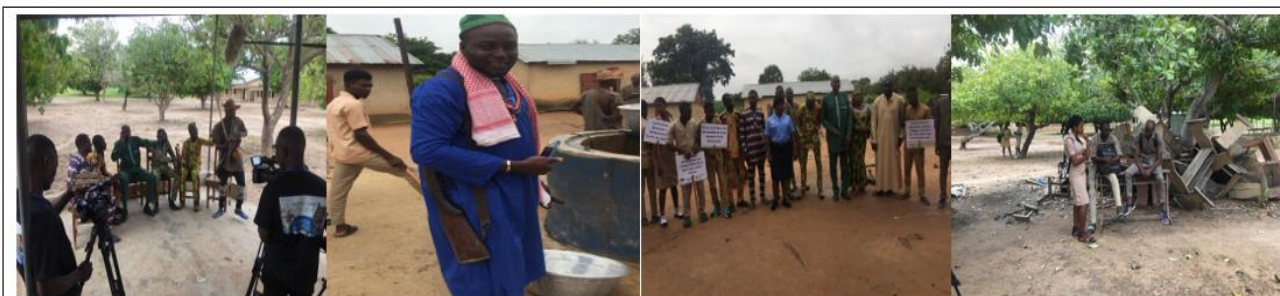
Tournage du film Zogui, qui relate les conflits éleveurs agriculteurs et la rupture du dialogue parents et enfants dans l'arrondissement de Bariénou, commune de Djougou

Après la validation du script du film, les équipes de tournage mis en place par le consultant réalisateur ont procédé aux différentes descentes sur le terrain pour les travaux de tournage, ensuite de traduction en langue Dendi du film qui a été ensuite sous-titré en langue française. Ce fut ensuite les étapes de validation de UD et ensuite du partenaire Social Watch et l'Union Européenne avant la phase de diffusion et de son utilisation en tant que support d'animation.