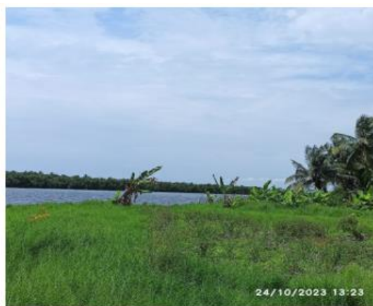
Image 1: Végétations de mangroves observées sur la berge de la rivière Diéssin