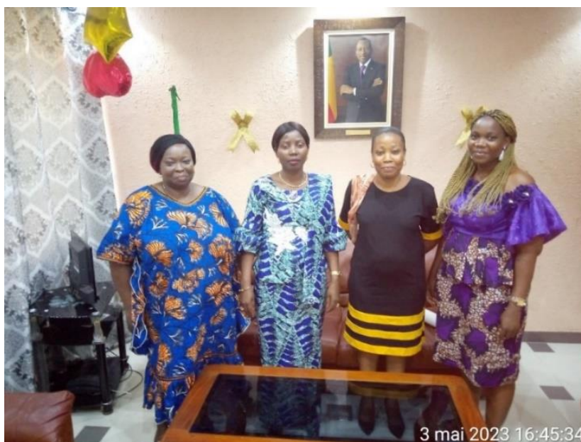
Photo 1 : Photo de famille avec Mme le Préfet de l'Ouémé à l'issue de la rencontre d'information et d'échanges autour des pratiques de GHM en milieu scolaire avec les autorités préfectorales à la préfecture de l'Ouémé (Porto-Novo)