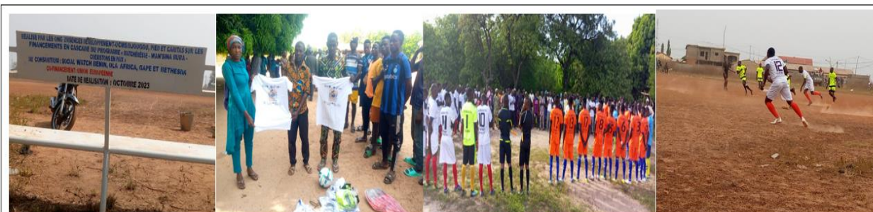
Organisation d'un championnat de football ainsi que la confection de sièges métalliques, l'aménagement et la réparation des poteaux du terrain de football, le don de nouveaux filets, et d'équipements et de ballon

L'organisation d'un championnat de football, ainsi que l'aménagement du terrain de football, la confection de sièges métalliques, le don de matériel sportifs aux joueurs ainsi qu'aux arbitres