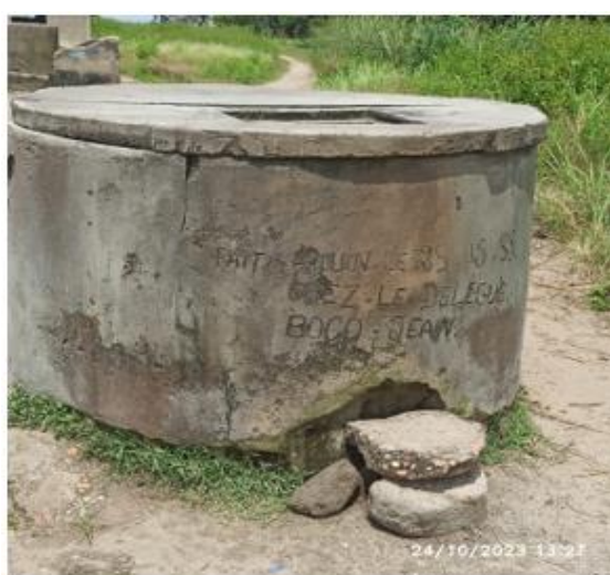
Image 2: Puits à grand diamètre délabré observé sur site datant de mai 1985