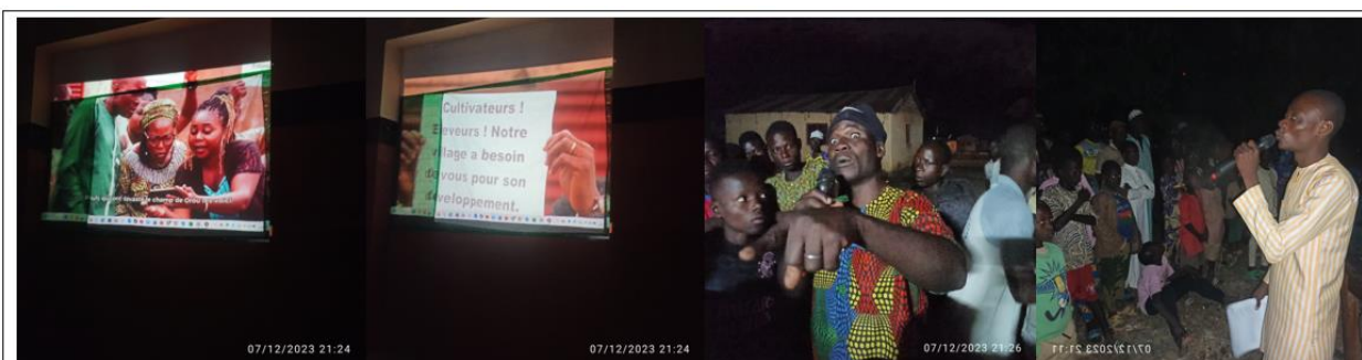
Réalisation des séances d'animations grand public conduites par le facilitateur du projet au niveau des localités ciblées

La figure suivante présente les séances d'animation grand public démarrées au cours du mois de décembre dans le cadre du projet et qui utilise le téléfilm comme support de sensibilisation. Il faut noter qu'un fil conducteur servant de fiche pédagogique a été réalisé et validé par le partenaire Social pour la conduite des animations.