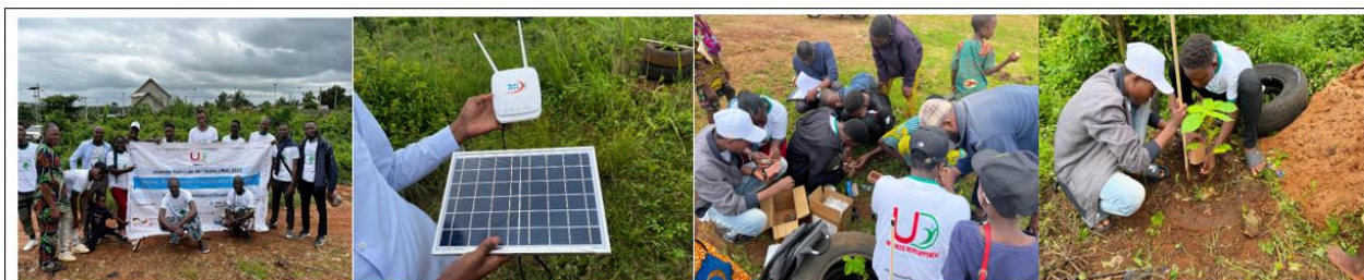
Photo de famille avec le chef du quartier louho, et installation des capteurs numériques sur les plants par les organisations de jeunes en challenge sous la supervision du partenaire Biris technologie lors de l'activité de mise en terre de plants avec les écoliers et la coalition des organisations de jeunes