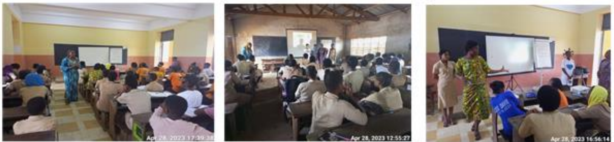
Formation des pools d'élèves filles sur les techniques élémentaires de prise de parole en public et de plaidoyer