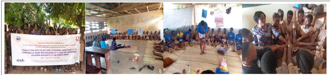
Formation des pools d'élèves filles des communes de Porto-Novo et d'Akpro-missérété sur l'hygiène menstruelle et corporelle