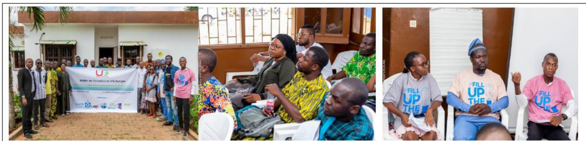
Photo de famille lors de l'atelier sur l'après COP 27, débat et présentation du rapport par l'équipe chef de rapporteur

Ensuite, les participants ont été initiés aux notions en lien avec les éco-gestes et solutions fondées sur la nature tout en associant. Cela à une activité de plantation d'arbre dans l'École Primaire Publique de Koutongbé. Il est important de souligner que deux enseignants de l'école ont pris part à toutes les activités de la journée y compris les différentes communications et panels.