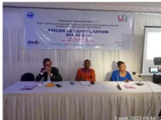
Cérémonie officielle de lancement de l'atelier de capitalisation des acquis du projet

Toutes les activités prévues dans le cadre du projet ont totalement été exécutées.