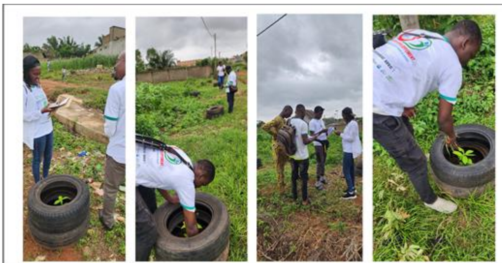
Quelques images illustrant la mise en terre des plants lors de la célébration de la JNA à Porto-Novo