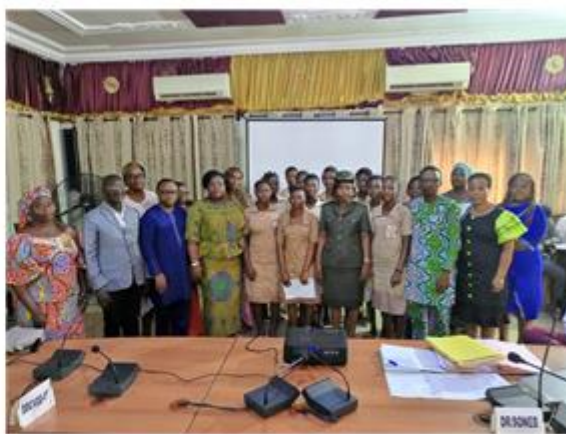
Images illustrant la réalisation de plaidoyers par les pools d'élèves filles à la préfecture de l'Ouémé lors de la conférence administrative départementale