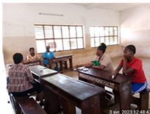
Formation des membres du cadre d'écoute et de conseils sur l'accompagnement psycho-affectif des filles en période menstruelle