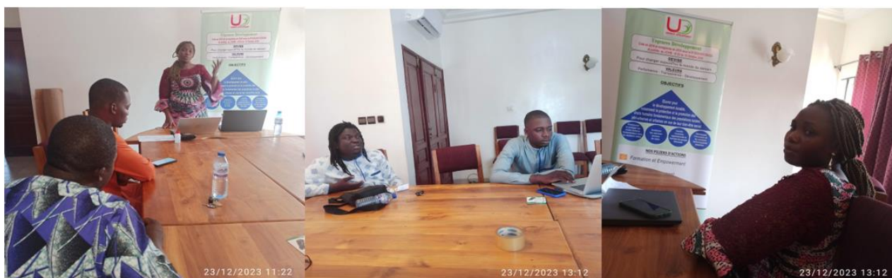
Photos des travaux de l'Assemblée Générale 2024 au siège de l'ONG

A l'issue des travaux de l'AG l'examen des rapports d'activités et financiers de l'année 2023 a été fait ainsi que les perspectives pour l'année 2024. Ceci a donc permis de dresser les bilans et perspectives pour 2024, notamment le niveau d'atteinte du plan stratégique ainsi que le plan d'actions 2024. On peut donc noter globalement que les objectifs assignés pour l'année 2023 sont atteints.