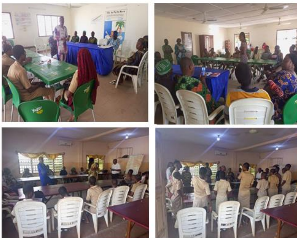
Les responsables des CEG/Lycées cibles et élèves filles et garçons en interface respectivement dans les communes de Porto-Novo et d'Akpro-Missérété