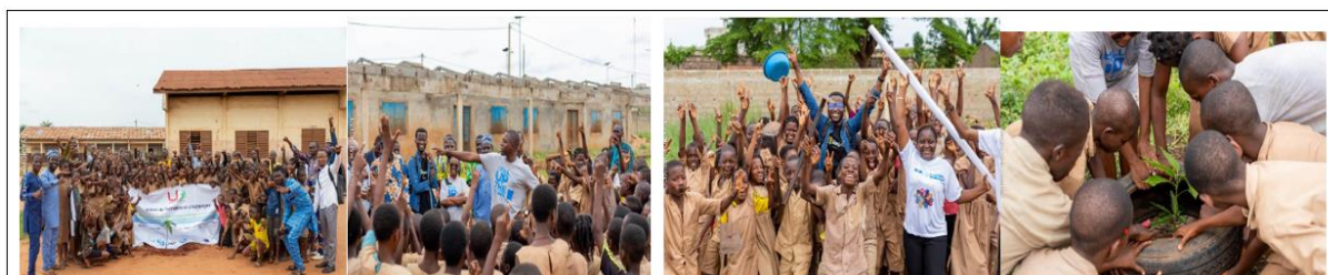
Photo de famille lors de l'activité de mise en terre de plants avec les écoliers et la coalition des organisations de jeunes

Ensuite, les participants ont été initiés aux notions en lien avec les éco-gestes et solutions fondées sur la nature tout en associant. Cela à une activité de plantation d'arbre dans l'École Primaire Publique de Koutongbé. Il est important de souligner que deux enseignants de l'école ont pris part à toutes les activités de la journée y compris les différentes communications et panels.