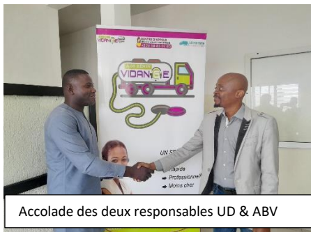
Accolade des deux responsables UD & ABV