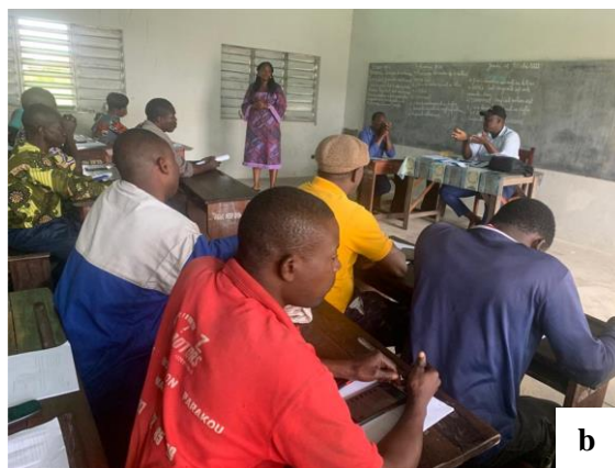
Planche 3 : Vue des participants à la séance de restitution par les CQ à leurs conseillers a) à Cadjèhoun Détinsa au 12 ème arrondissement de Cotonou et b) Tonato au 8 ème arrondissement de Cotonou.