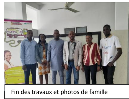
Fin des travaux et photos de famille