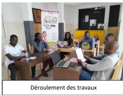
Déroulement des travaux