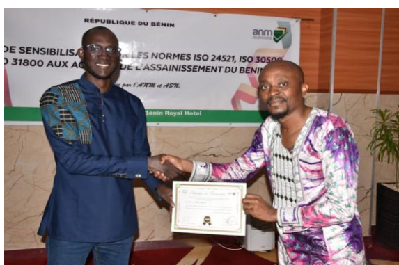
la Société sénégalaise de normalisation