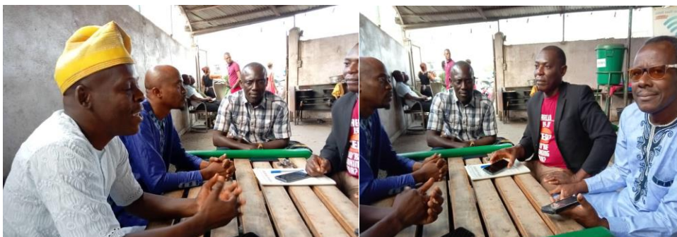
Photos de la séance de travail avec la délégation de l'association ADEHA