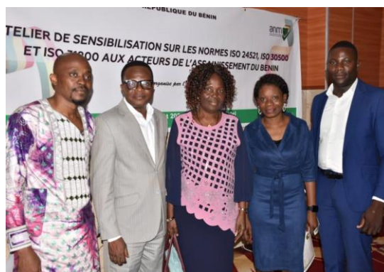
Directeur de l'ANM